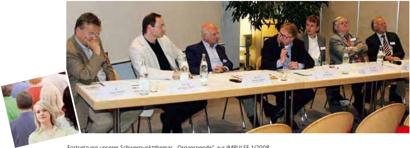
Fortsetzung unseres Schwerpunktthemas „Organspende“ aus IMPULSE 1/2008